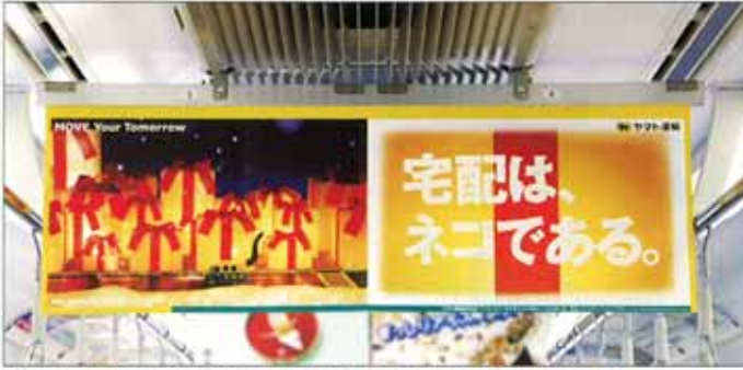
ワイド：中吊り全面が独占できます。ワイドでインパクトある広告訴求が可能です。