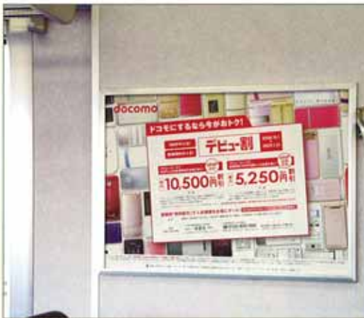
新B額面ポスター： 乗降ドアの側壁での掲出になります。