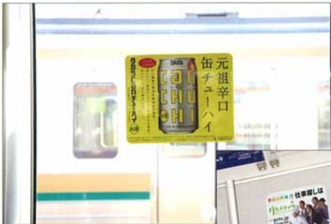
ステッカー： 乗降ドア横・窓ガラス面での掲出になります。